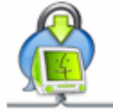
ChatBarrier X3 Install

Doppelklicken Sie auf das Symbol für das Installationsprogramm von Intego ChatBarrier X3.